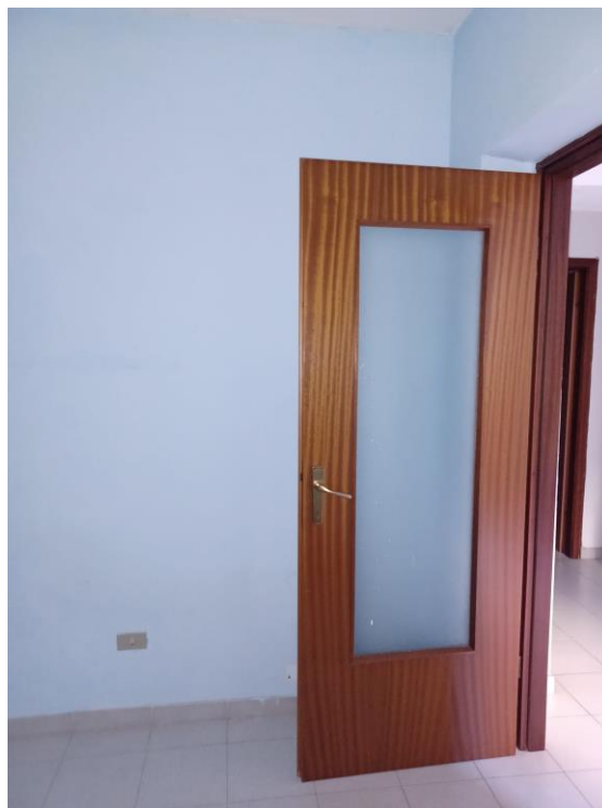
PORTE INTERNE- PARTICOLARE